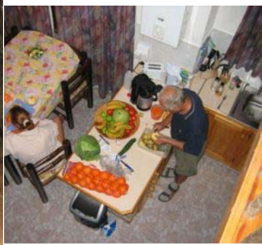
keuken en eetgedeelte