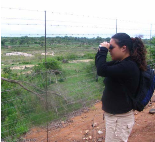
uitkijkend op de Wildtuin

De gekko's sprongen je om de oren. De kleine waterhole was gevuld met water, zadjes voor de vogels waren gestrooid. We waren klaar voor een week midden in de natuur. Ontspannend in de hangmat, omringt door vogels, krekels een kleine schildpad die heen en weer door de tuin liep, was het echt een kwestie van aarden. De rust kwam over ons en we genoten.