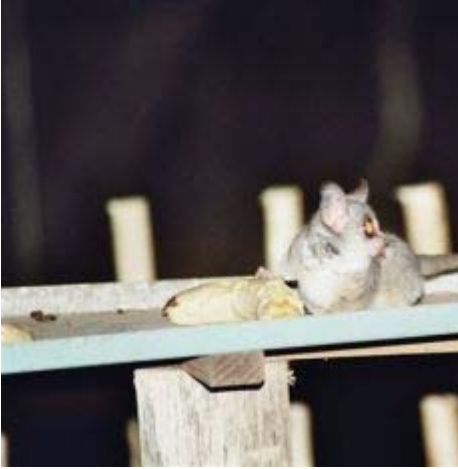
nachtaapje in de tuin