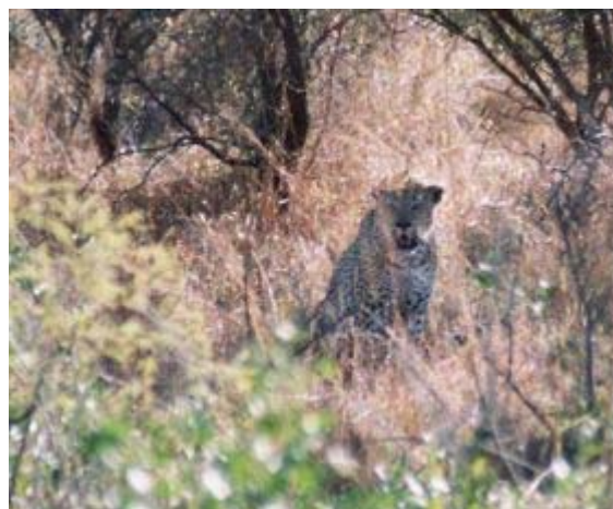
luipaard in KNP