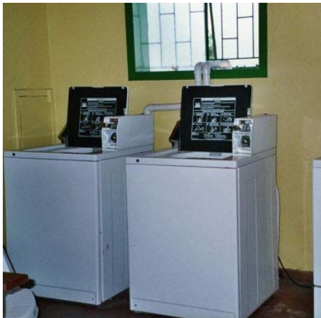
wasserette in Marloth Park