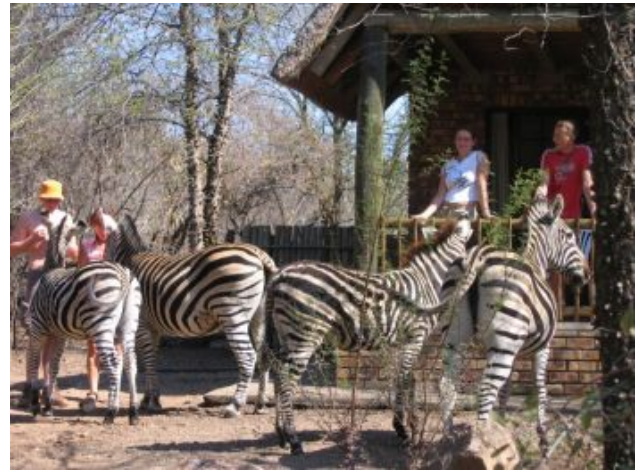
zebra's in de tuin