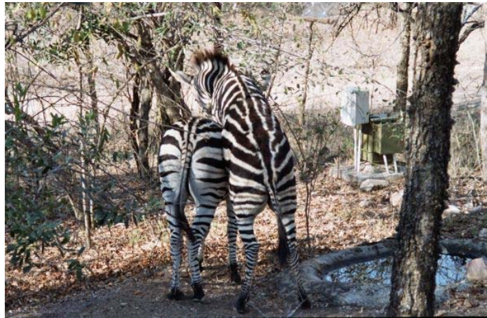
spelende zebra in de tuin