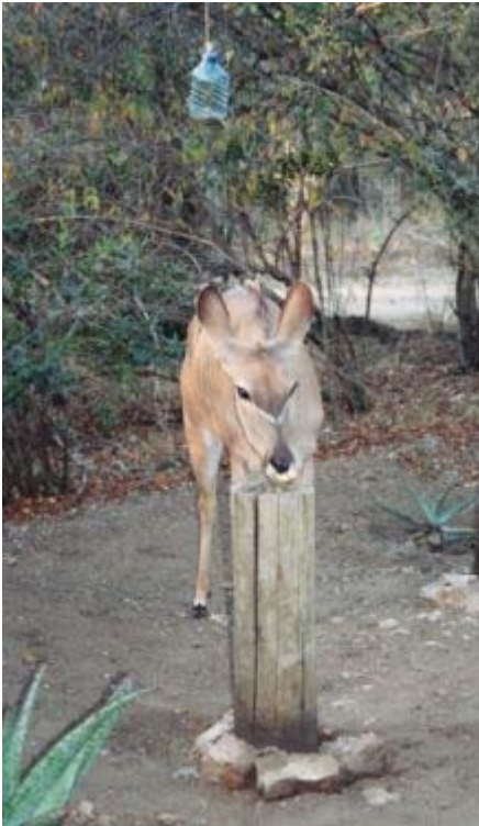
kudukalf eet een banaan in onze tuin