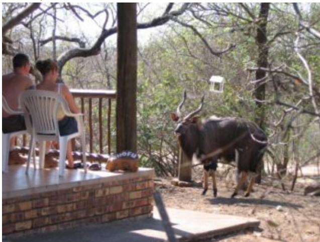
nyala (man) in de tuin