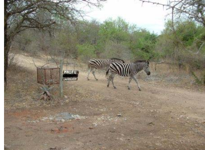
zebra's op het pad