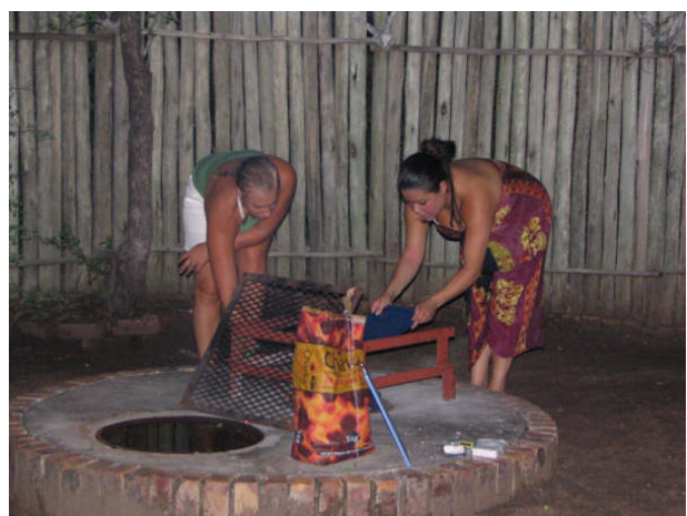
braaien in onze tuin

Op een morgen werd ik om 06:00uur al wakker en besloot om een rustige start op de veranda in de hangmat te maken, samen met een kopje thee. Komt me daar toch een hele troep van zeker 15 bavianen langs. Binnen de kortste keren waren ze overall! Ze