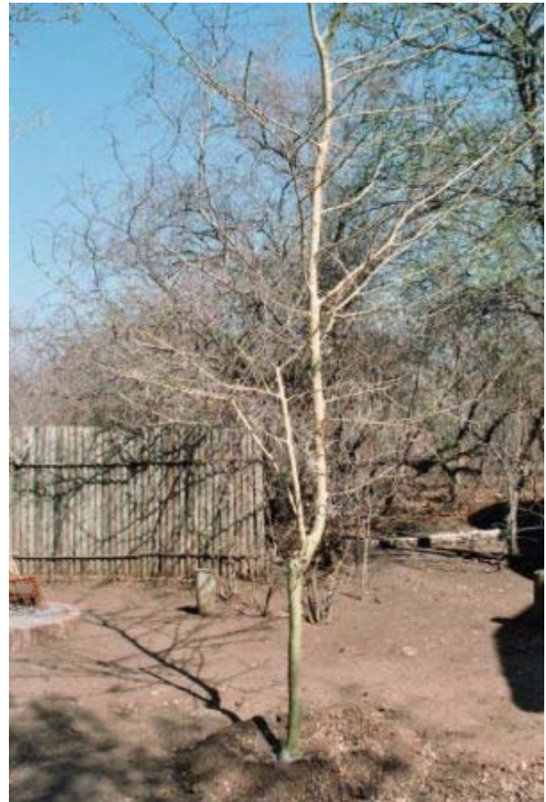
gele koortsboom in onze tuin