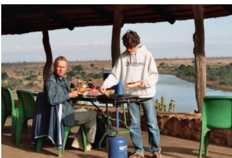
Ontbijten bij Mfolozidam KNP