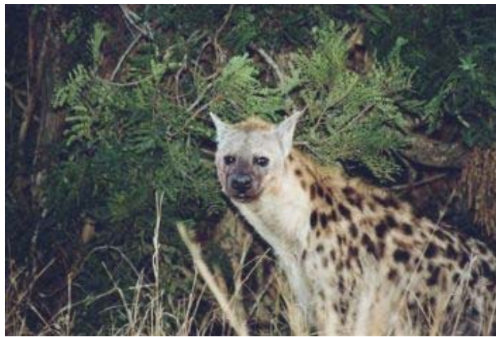
Hyena in KNP