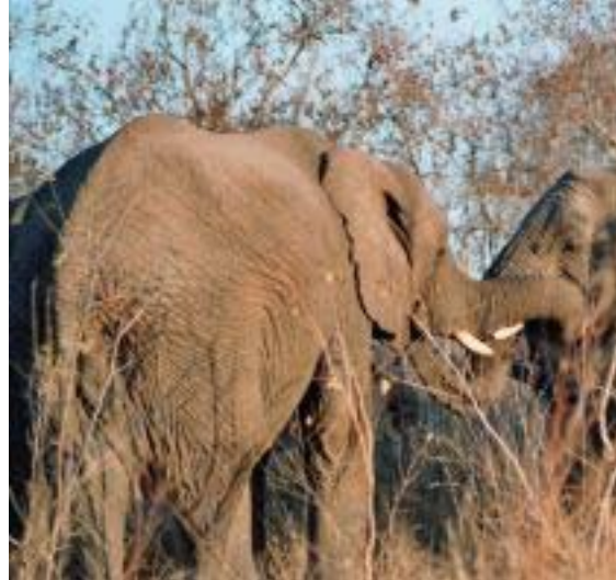
spelende olifanten in KNP