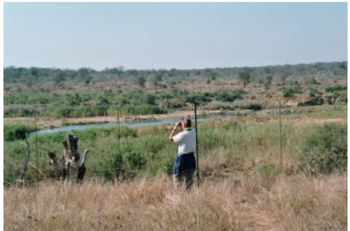
Ivo aan de rivier, 200 mt van ons huis