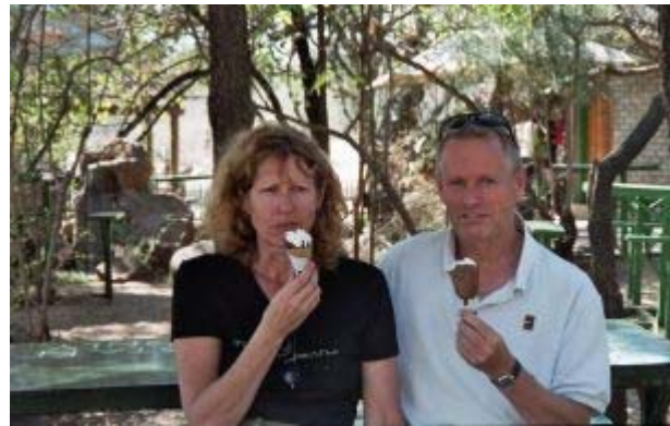
ijsje eten bij de Trading Post, MP.