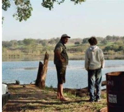
tygerfishing Komati / Krokodil rivier