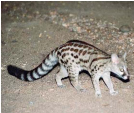
large spotted genet cat