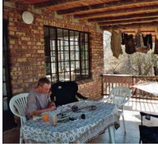
Ivo aan het werk op de veranda