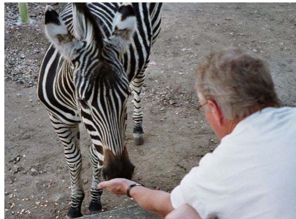
zebra en Ivo in onze tuin