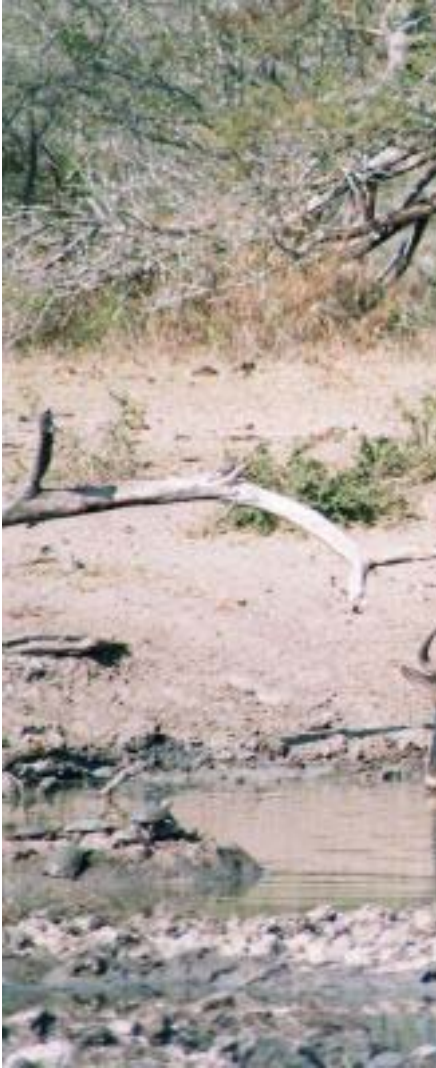
drinkende gnoes in Umfolozi