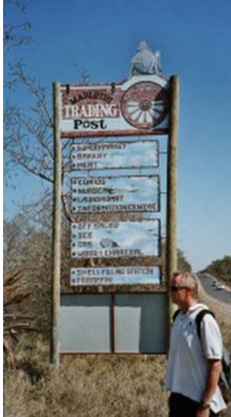
bij Trading Post, winkels/wasserette/tankstation et