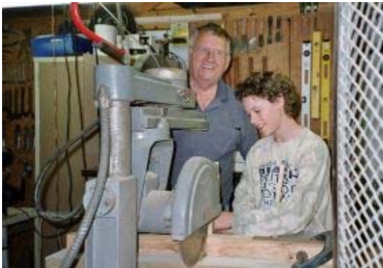
Fritz en Bob maken vogelhuisje