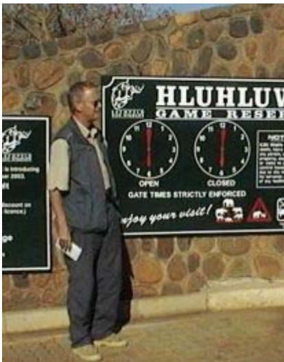
entree Hluhluwe Umfolozi