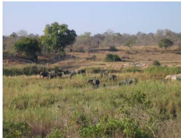
kudde olifanten aan de rivier