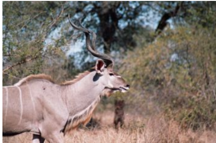
kudu man in KNP