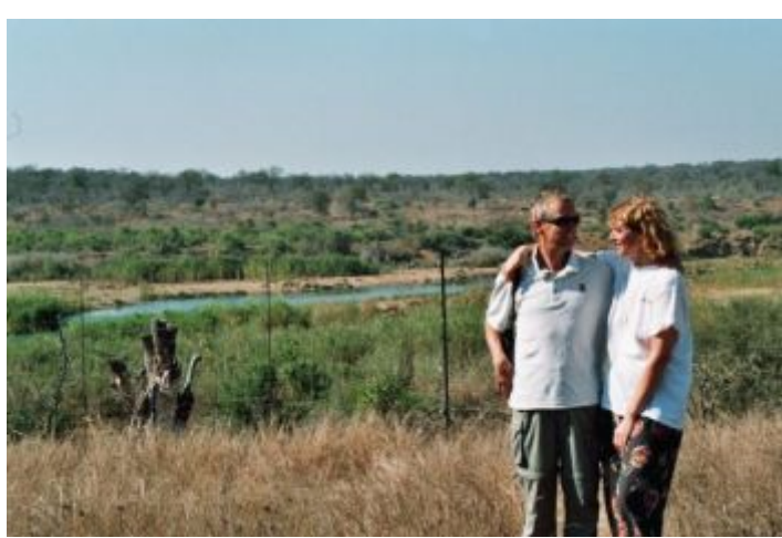
aan de rivier krokodil in MP