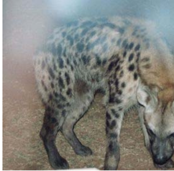
hyena op terras in Mpila, Umfoloz i