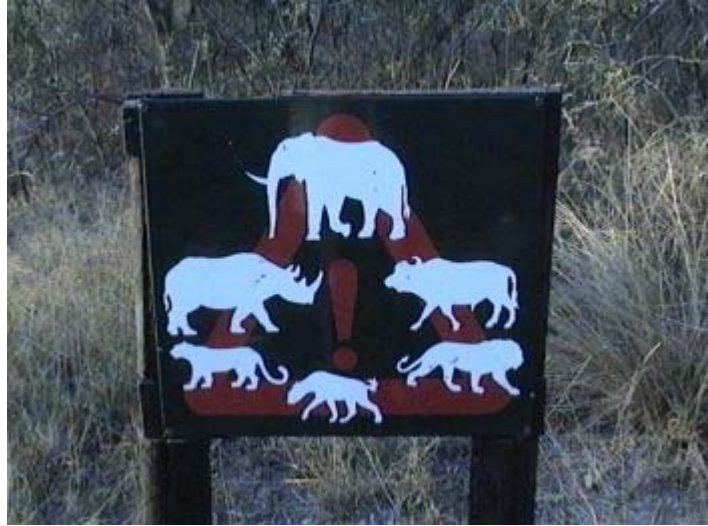
waarschuwingbord bij huis in Mpila