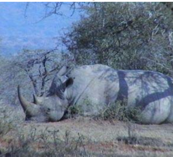
witte neushoorn in Umfolozi