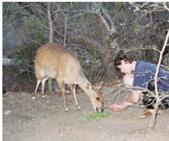
bushbok in de tuin