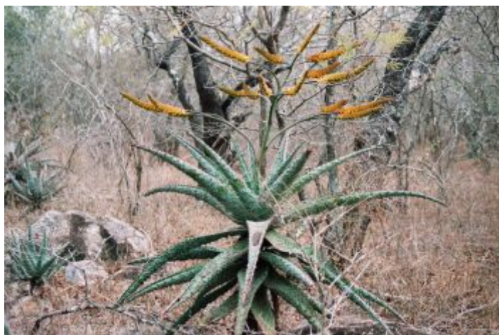
aloë in de tuin