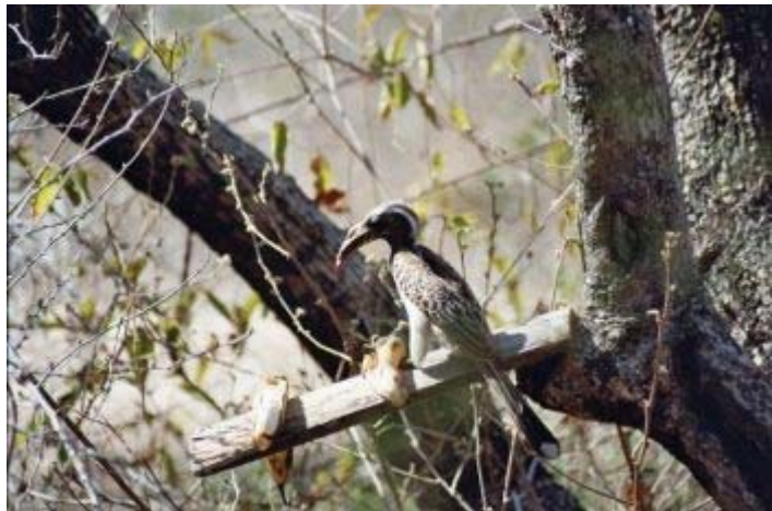
hornbill op onze voederplaats