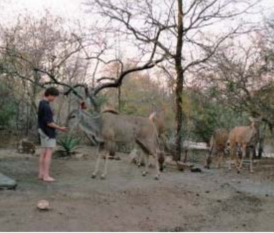
kudu in de tuin