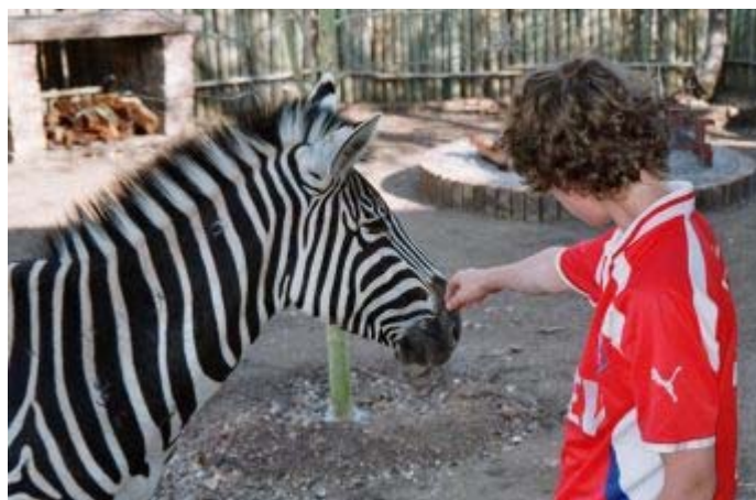
zebra n bob in onze tuin